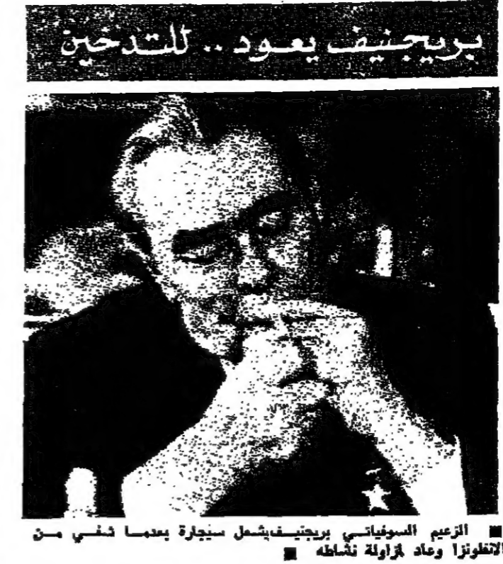
الزعيم السوفياتي بريجنيف يشعل سيجارة بعدما نشي من التطويرات وعاد لزيارة موسكو

صحيفة المانية: السادات رجل دولة محتك. وأشارت الصحيفة إلى أن السادات رجل دولة محتك. وأشارت الصحيفة إلى أن السادات رجل دولة محتك.